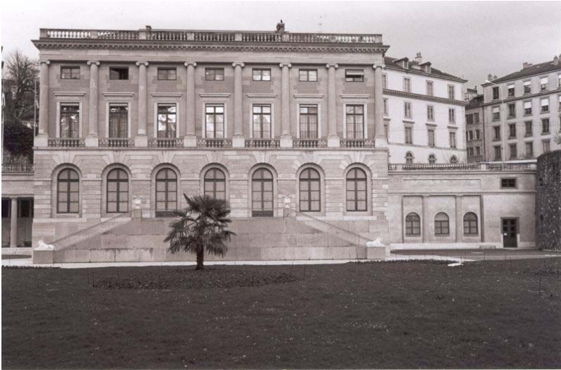
Le Palais Eynard et les Archives de la Ville de Genève vus du parc des Bastions