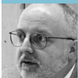
■ François Burgy Archives de la Ville de Genève